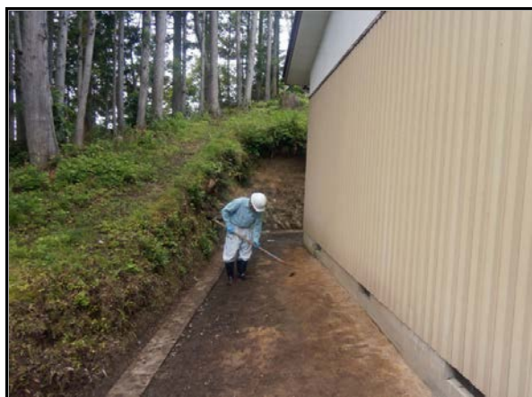
表土剥ぎ取り(人力)