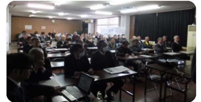
たくさんの方に お集まりいただきました！