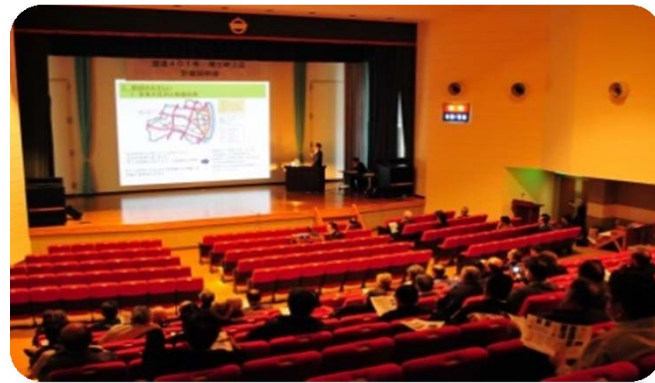
たくさんの方に お集まりいただきました！