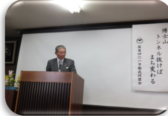
渡部町長よりごあいさつ

平成28年 3月21日(月)会津美里町会場 (会津美里町公民館) 参加者 38名