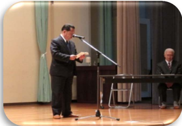
馬場村長よりごあいさ