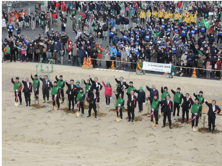
ひろの防災緑地植樹祭の様子