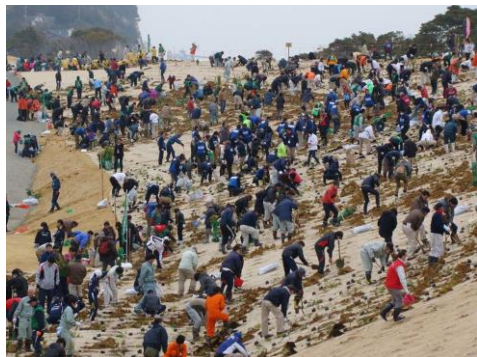
ひろの防災緑地植樹祭の様子

苗木たちが大きな森となって、私たちの生活を守り、地域の交流の場となるよう、地元のサポーターズクラブを中心に、皆さまの御協力をよろしくお願いいたします。