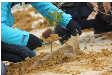
ひろの防災緑地植樹祭の様子