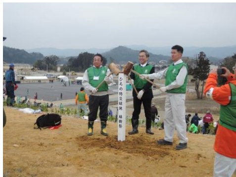
ひろの防災緑地植樹祭の様子