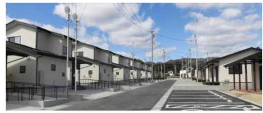
小川町家ノ前地区 復興公営住宅

この記事の問い合わせ先： いわき建設事務所 建築住宅課 0246-24-6131