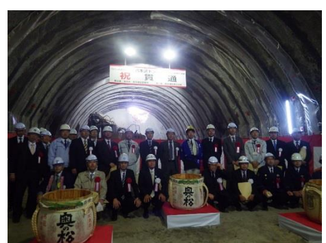
八木沢トンネル貫通式の様子

平成28年3月20日（日）に八木沢トンネルが貫通し、同日に貫通式が開催されました。