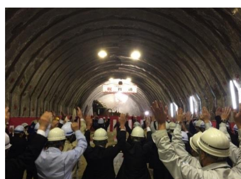
八木沢トンネル貫通式の様子