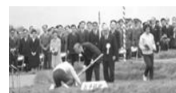
昭和45年第21回大会での天皇陛下によるお手植えの様子

「全国植樹祭」とは、森林や緑への理解を深めるため天皇皇后両陛下をお招きして開催される、国土緑化推進運動の中心的な行事です。福島県では昭和45年に開催して以来、48年ぶり2回目の開催となります。