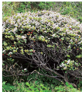
マルバシャリンバイ