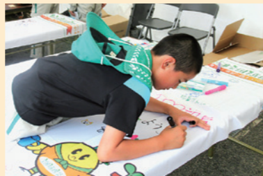
福島県全国植樹祭 検索

今後も歓迎メッセージの作成ブースを設けますので、ぜひ「のぼり旗」へメッセージを書き込んでくださいね。