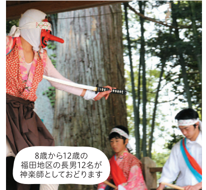
8歳から12歳の福田地区の長男12名が神楽師としておどります

福田諏訪神社の例祭に扇神子や獅子舞などを奉納します。出雲系法印神楽という福島県では珍しい神楽です。福島県重要無形民俗文化財に指定されています。