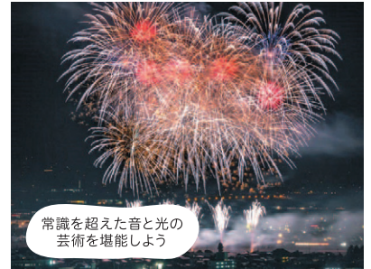
常識を超えた音と光の芸術を堪能しよう

内閣総理大臣賞受賞花火師8社が集結! 圧巻の最大400メートルミュージックワイドスターメインなど、昨年より玉数が増えて、よりダイナミックに演出します!