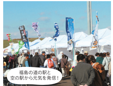
福島県の道の駅と空の駅から元気を発信!

ふくしま地産地消費フェア～ふくしま道の駅・空の駅まつり～が今年も開催されます。県内外から多くの道の駅が出展し、ご当地グルメや特産品を販売します。