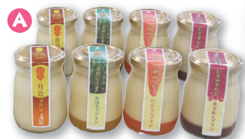
プリンセットお届け内容 黄色いハート・御前人参・むすめきたか など計8個