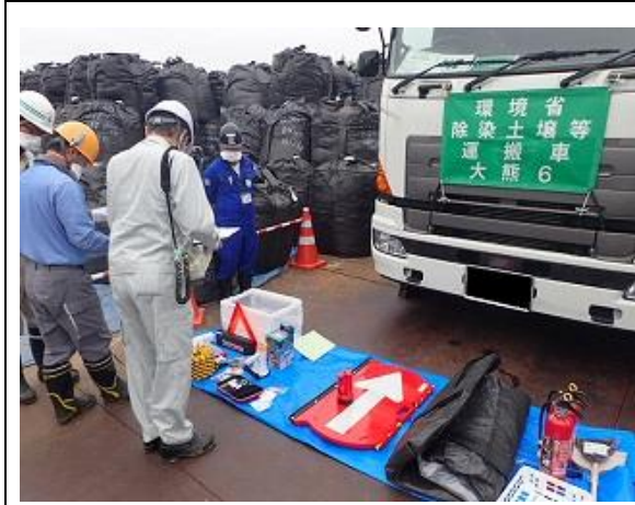
輸送車両の携行品確認