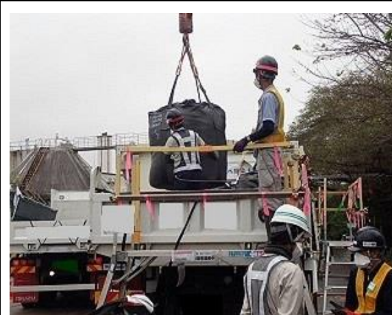
除去土壌等の積み込み作業確認 1