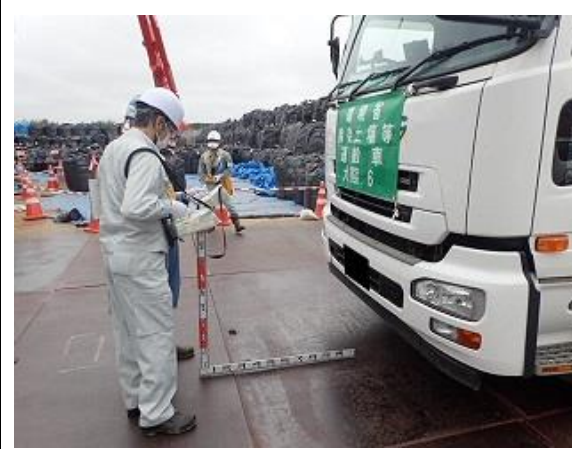
輸送車両の空間線量率測定