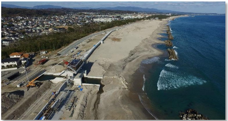
沼ノ内地区・夏井地区