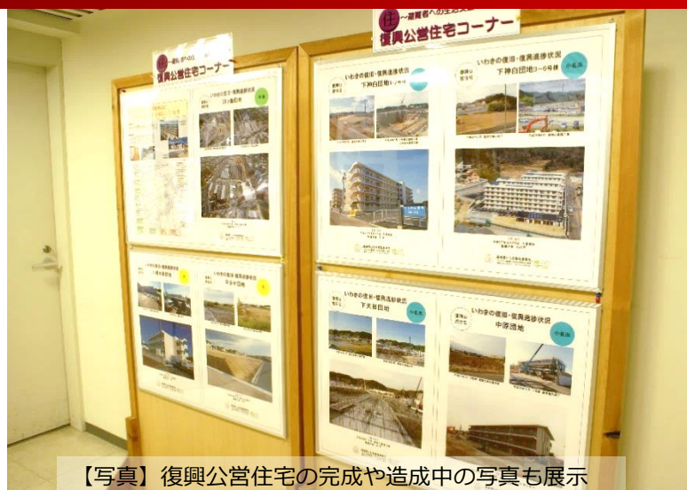
【写真】復興公営住宅の完成や造成中の写真も展示