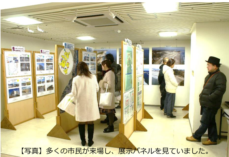
【写真】多くの市民が来場し、展示パネルを見ていました。

当所では、基本方針である「被災者や長期避難者の生活再建を支援し、復興の着実な進展と地方創生を実感できる社会基盤の整備」に取り組む中、復興公営住宅