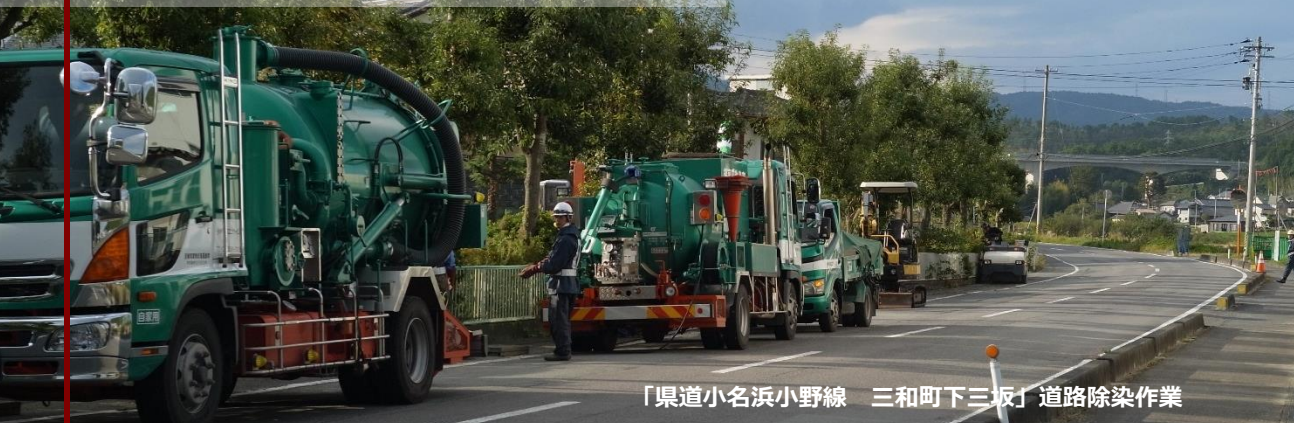
「県道小名浜小野線 三和町下三坂」道路除染作業

いわき市内の県管理施設の除染が完了「管理課」 — 安心していわきに「来て」ほしい —