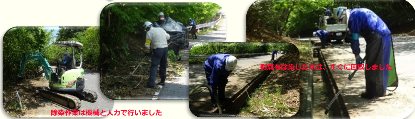
除染作業は機械と人力で行いました

福島県内では、各地に飛散した放射性物質を取り除くため、国や市町村がそれぞれ「除染実施計画」を作成して、除染作業を行っています。 いわき市内では、「いわき市除染実施計画」に基づいて除染作業を行っており、県の管理施設も、平成25年度から除染作業を開始して、平成29年9月いっぱいまで作業が完了しました。 皆さまの安全・安心につながる各施設の管理を引き続き行います。