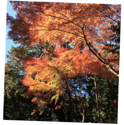
いわき市 諏訪八幡神社