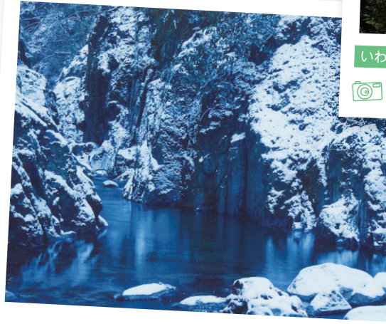
いわき市 せとがら 背戸岨廊