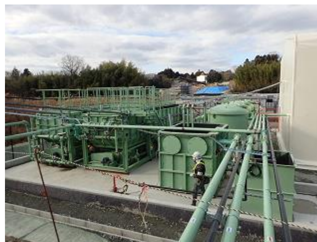
浸出水処理施設の確認