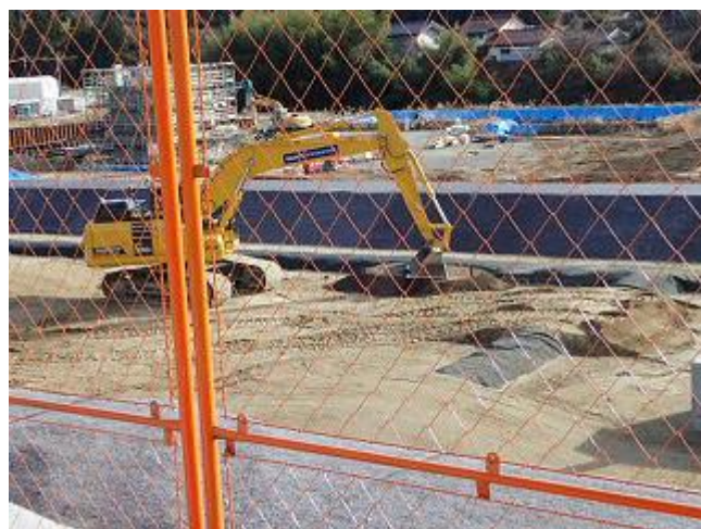
重機による埋立作業の確認