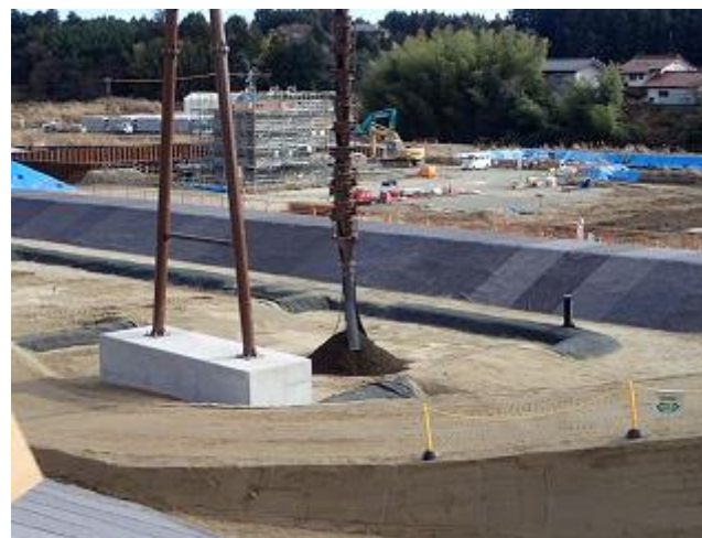
汚染土壌の搬入状況の確認