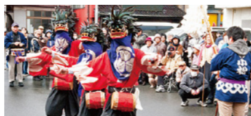
会津彼岸獅子(会津)