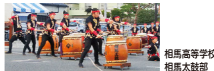
相馬高等学校 相馬太鼓部