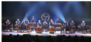
山木屋太鼓(中通り)