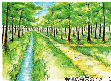
会場の将来のイメージ