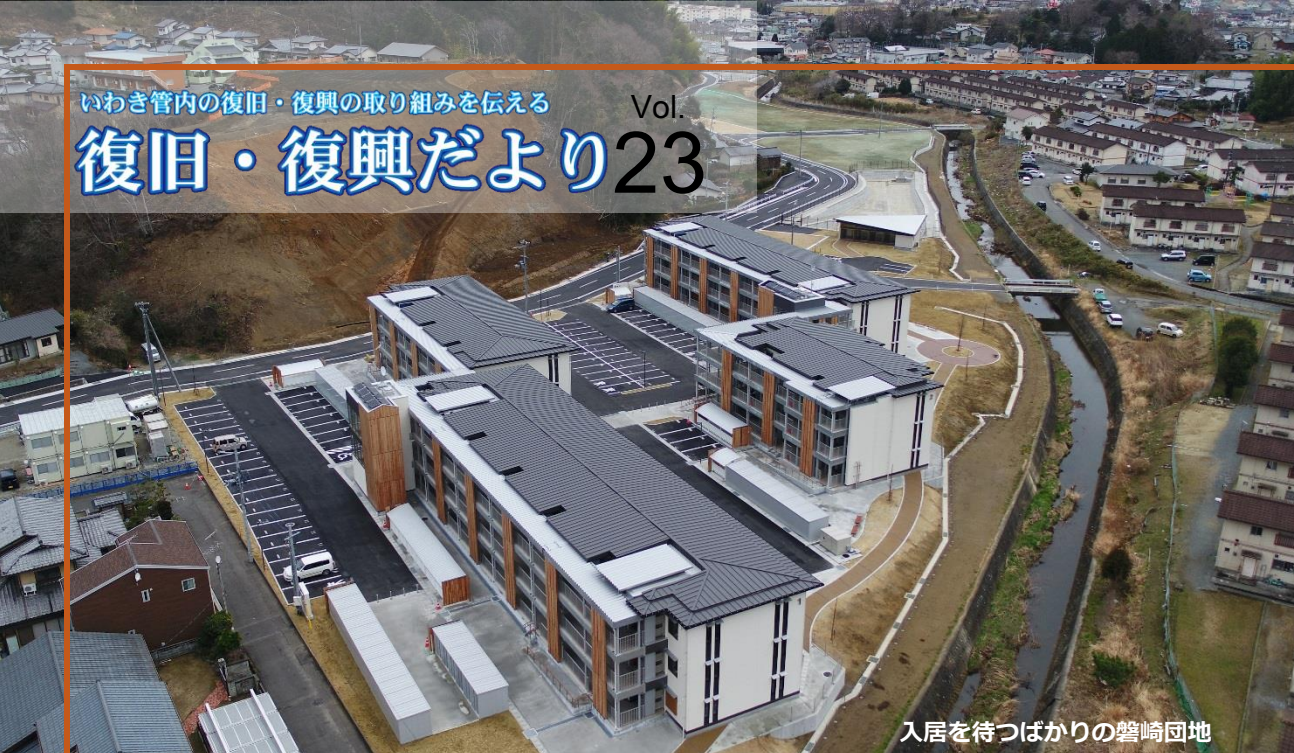
入居を待ばかりの磐崎団地

津波被災地域で初めて全事業が完了、復興公営住宅の整備も完了しました ― 次々と復旧・復興が進み、着実に歩みを進めています ―