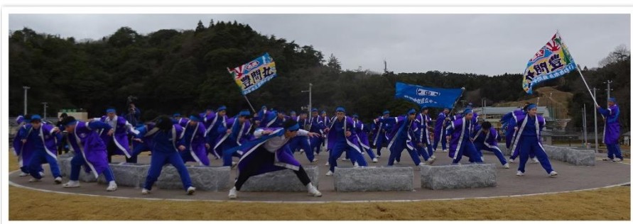
豊間中1・2年生による「よさこい」が、竣工式に彩りを添えました