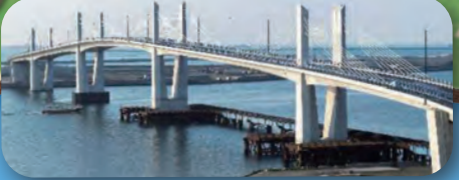
小名浜マリブリッジ ※毎週日曜日に歩道を一般開放 (平成30年11月30日まで)

※本マップは、平成27年度に小名浜の新たな魅力創造事業に係るワーキンググループが作成したマップを、いわき市が再編集したものです。