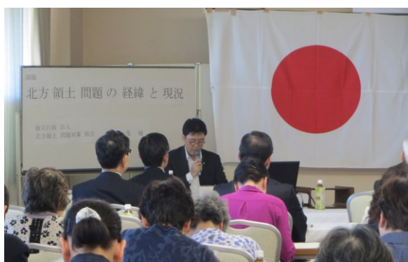
(独)北方領土問題対策協会 林氏による講演