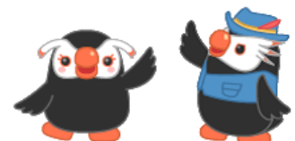
北方領土イメージキャラクター「エリカちゃん」、「エリオくん」

TEL:024-521-7013 Fax:024-521-7934 Mail:koucho@pref.fukushima.lg.jp