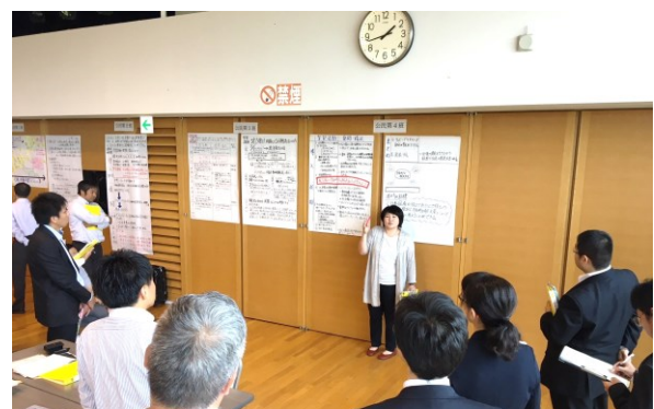
授業構成案の発表