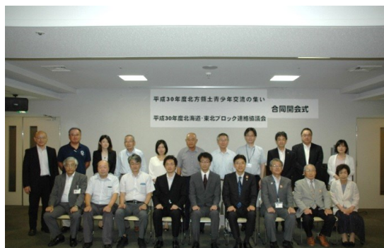
ブロック連絡協議会集合写真

また、(独)北方領土問題対策協会の担当者からは、元島民の航空機特別墓参の実施状況等の最新の情勢について報告がありました。