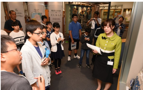
北方四島交流センター(ニ・ホ・ロ)での説明員による案内