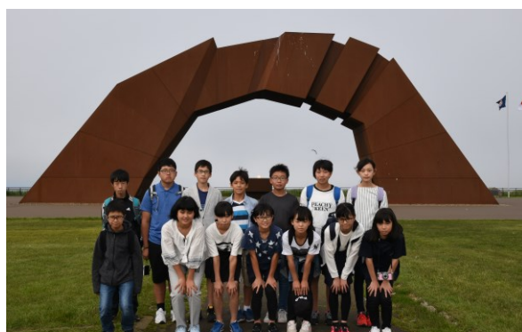
北方領土返還記念シンボル像 四島(しま)のかけ橋