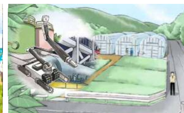
【農用地活用イメージ】