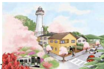
【人と桜の共生イメージ】