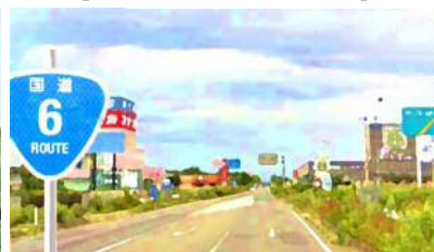
【沿道型商業活性化イメージ】