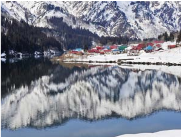
5. 只見川 (金山町) 問金山町産業課 ☎ 0241-54-5327

まだ春浅い中にも、少しずつ何かが始まる予感を感じる……ゆるやかに芽吹いてくる福島春の春景は私たちの宝物。そんな変化を楽しみに、県内各地を訪れてみてはいかがでしょうか。