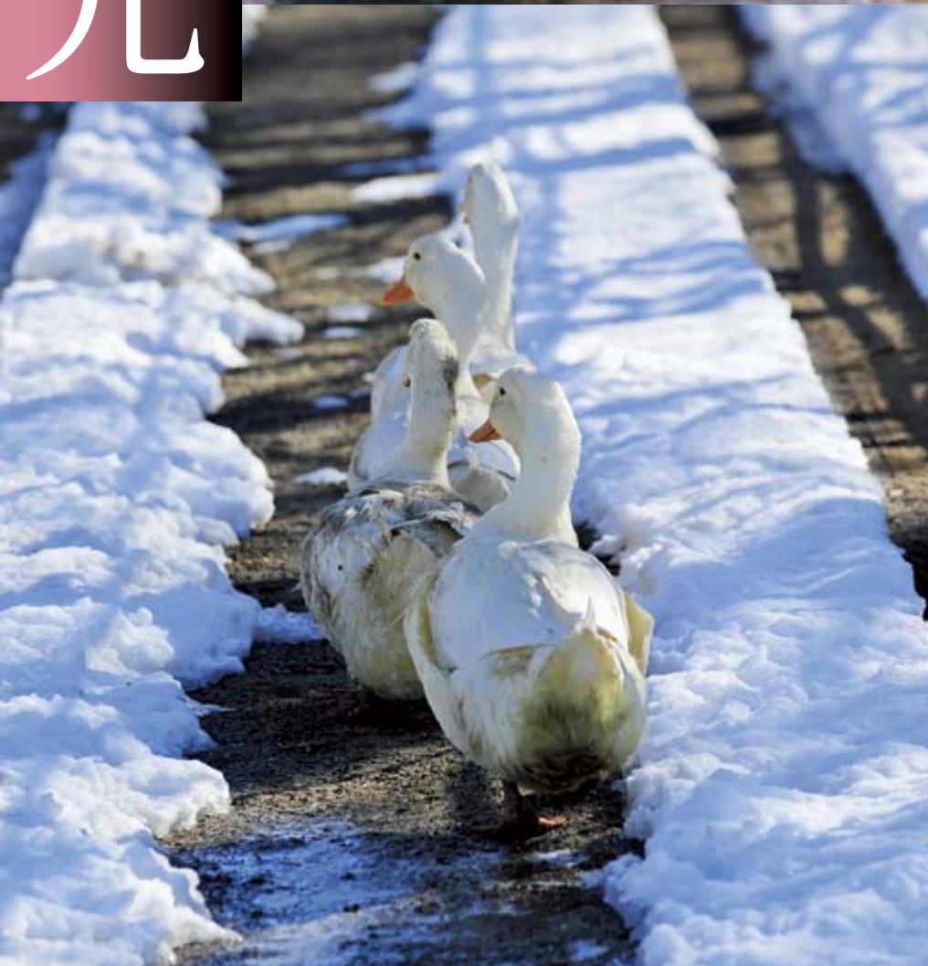
2. 早春の須賀川牡丹園（須賀川市） 関(公財)須賀川牡丹園保勝会 ☎ 0248-73-2422

12月号の表紙の子どもたちの笑顔は本当に私まで楽しくなるし、この子どもたちと福島県の子どもたちがこれからもこういう楽しい顔でいられるよう祈っています。（桑折町 60代女性）