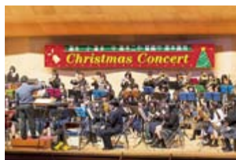
地域の小・中・高校合同で行われた演奏会

現在は、3月に東京で開催される東日本大震災復興支援チャリティコンサートへの出演や、定期演奏会に向けて、日々練習に励んでいます。