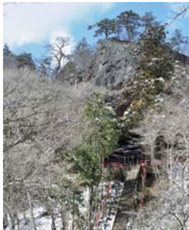
6. 山本不動尊 (棚倉町) 問棚倉町観光協会 ☎ 0247-33-7886