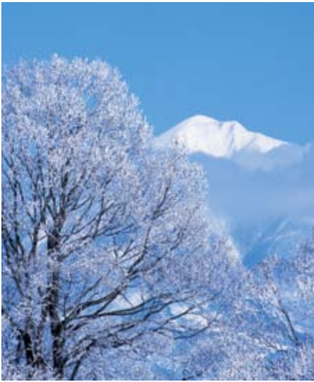
4. 里からの磐梯の頂 (会津若松市) 問会津若松市観光課 ☎ 0242-39-1251