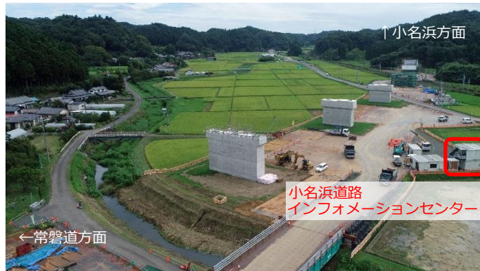
小名浜側の第4号橋の橋脚3基の工事は終わっています