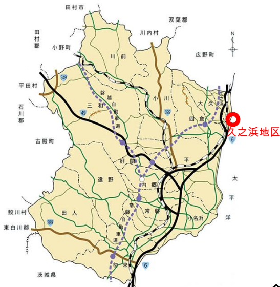
- 久之浜地区の位置 -

そのような状況下にあったいわき市も、沢山の皆様のご支援ご協力により、目覚ましい復旧・復興を成し遂げようとしております。復旧・復興事業の一環である防災緑地の整備も、今年度全ての防災緑地が完成し、供用を開始します。防災施設として地域のみなさんを守り、そして憩いの場として皆様にご利用いただけることを心より願っております。