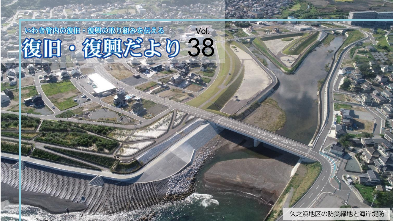
久之浜地区の防災緑地と海岸堤防

栃木県から来た応援職員 久之浜地区防災緑地を担う ― 憩いの場として 皆様にご利用いただきたい ―