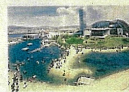
アクアマリンふくしま