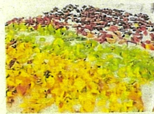
アートプログラム