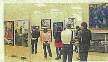
福島県総合美術展覧会