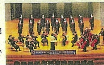
声楽アンサンブルコンテスト全国大会