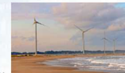
万葉の里風力発電所 (南相馬市)