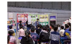
ふるさと創造学サミット(双葉郡8町村の小中学校等)