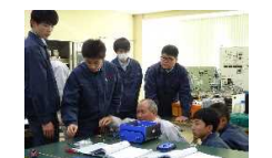
小高産業技術高校×会津大学