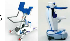
移動介助・移動支援機器等の実用化開発(株)アイザック