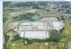
IHI工場 (相馬市)