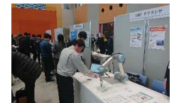
ふくしまみらいビジネス交流会