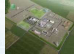
福島ロボットテストフィールド