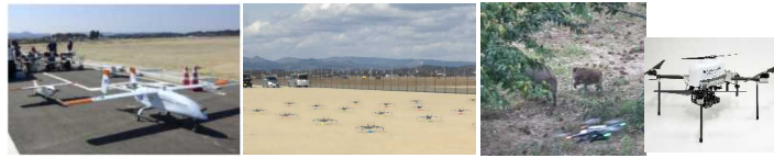
福島ロボットテストフィールドでのドローン実証