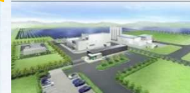
※東芝エネルギーシステムズ(株)資料