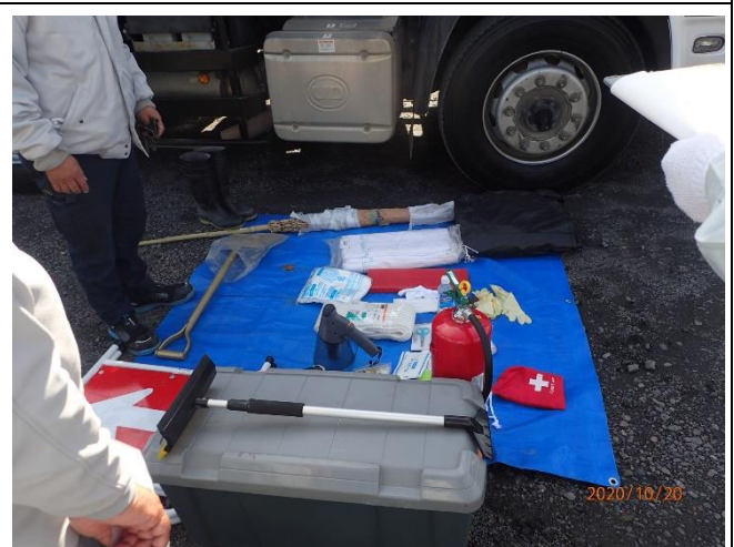
輸送車両の携行品確認