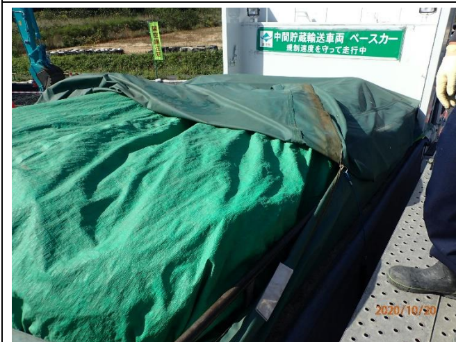
シートによる飛散・流出防止対策