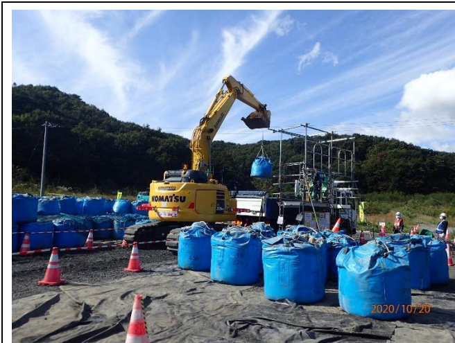
除去土壌等の積込作業