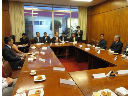
本県が招致した県費留学生や短期研修生、技術研修員との懇談を深めた

概 要：知事が、これまで本県が招致した県費留学生や短期研修生、技術研修員の方と、福島県での思い出や、本県で習得したことを、その後どういかしているかなどについて懇談を行いました。