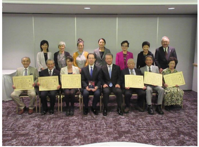
出席者での記念撮影