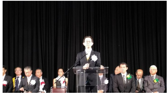
御祝いの挨拶を述べる内堀知事