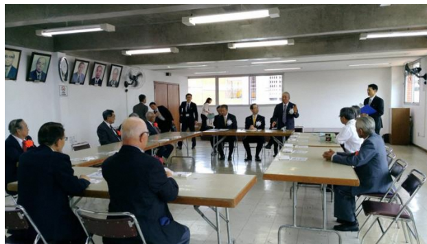
ブラジル福島県人会の役員等との懇談

内 容：知事が、ブラジル福島県人会の役員等に対し、式典招待への御礼を述べるとともに、懇談を通して親交を深めました。