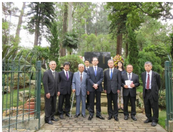
慰霊碑の保全に御尽力いただいている関係者との記念撮影

概 要：日系移民の先没者の慰霊碑を参拝し、幾多の困難を乗り越えて現地で確固た る地位を築いてこられた先人の方々を慰霊するとともに、慰霊碑の保全に御尽 力いただいている関係者へ御礼の意を伝えました。