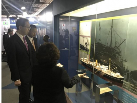
史料館を視察し、先人達の足跡と苦勞に理解を深める

日本人移住者が幾多の困難を乗り越え、いかに現在の地位を築いてきたかについて理解を深めました。