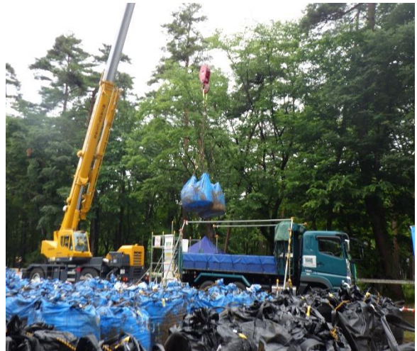
除去土壌等の積込作業