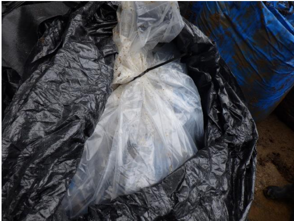
除去土壌等の封入状況