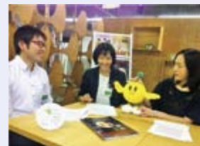
◀Hanakoの北脇編集長(右)とオリジナルの旅プランを検討。