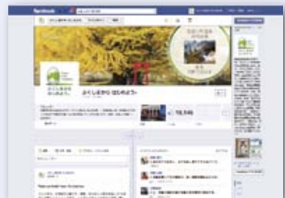
▲県公式フェイスブックページ 「ふくしまから はじめよう。」