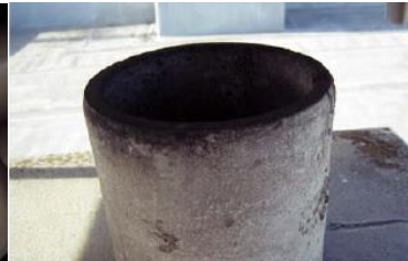
煙突の内側に使用 石綿含有断熱材