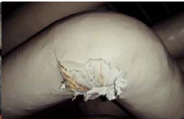
エルボ部に使用 石綿含有保温材