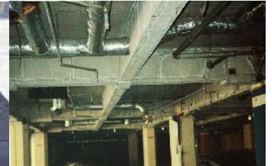
鉄骨を被覆して保護 石綿含有耐火被覆材