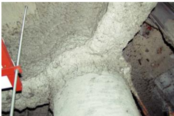
柱や梁に施工 吹付け石綿