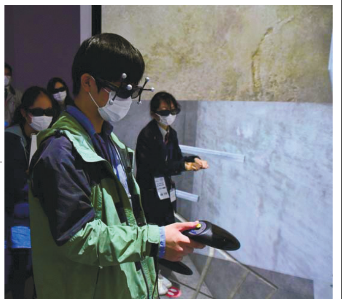
VRで原子炉内を疑似体験

研究管理棟では原子炉を4面スクリーンで立体的に再現したバーチャルリアリティ（VR）が体