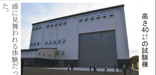
高さ40メートルの試験棟

験ができる。基になった映像は実際にロボットが炉内を撮影したものだ。画面には空間線量なども表示され、臨場感あふれる映像と相まって、緊張