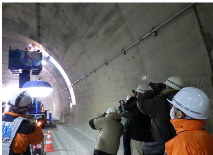
間近での補修作業