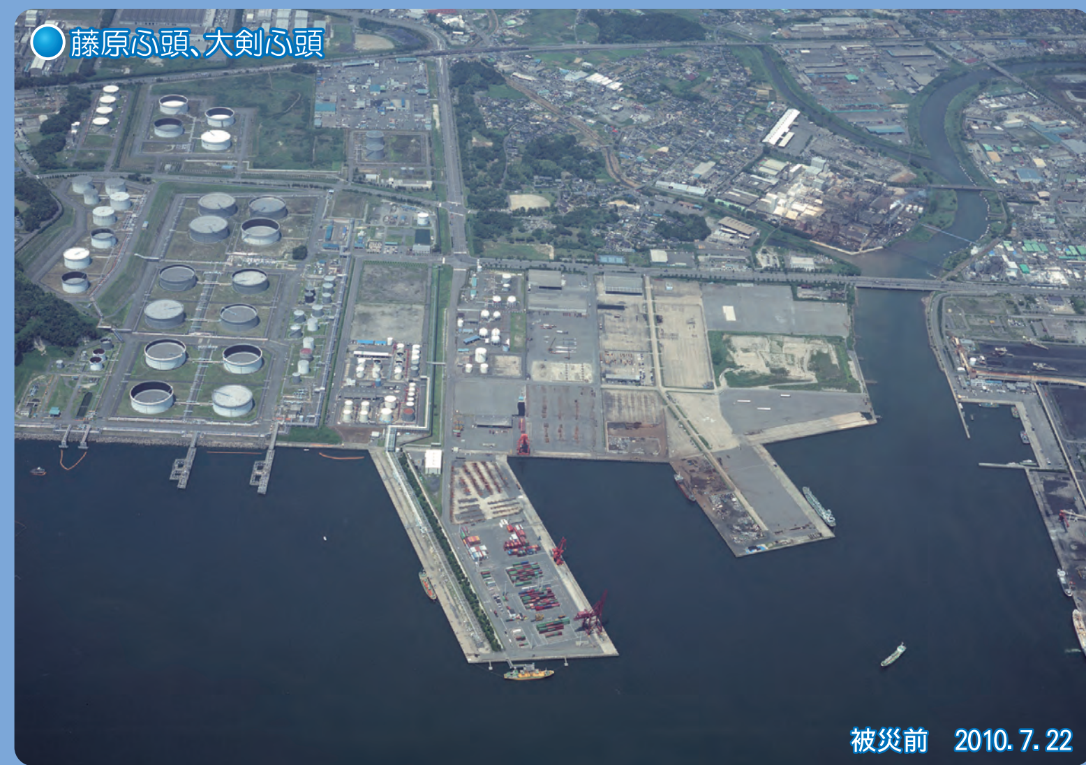
被災前 2010. 7. 22