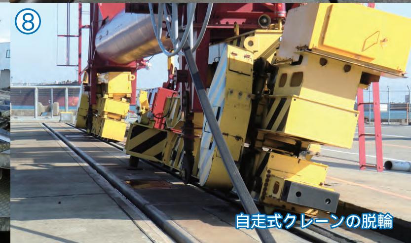
自走式クレーンの脱輪