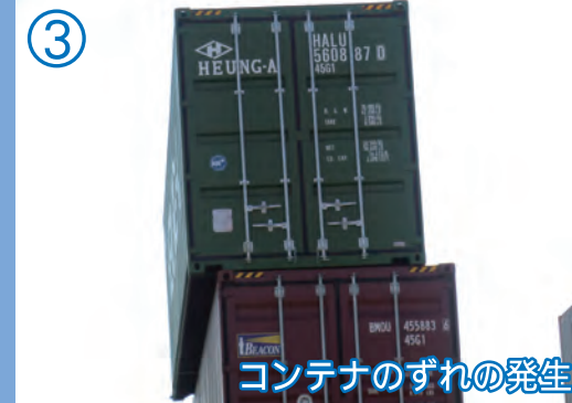
コンテナのずれの発生