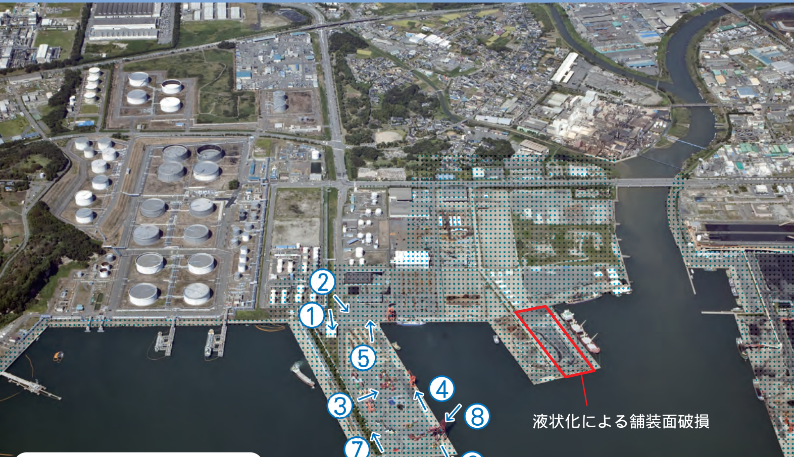
液状化による舗装面破損