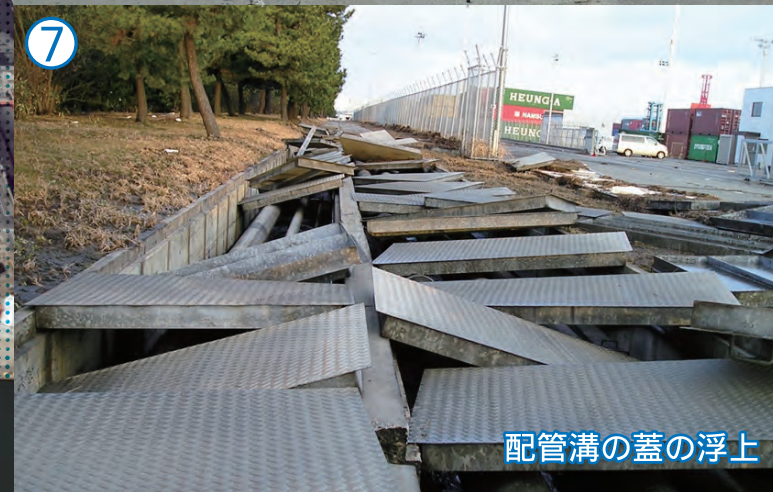
配管溝の蓋の浮上