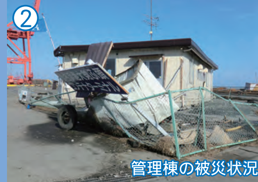
管理棟の被災状況