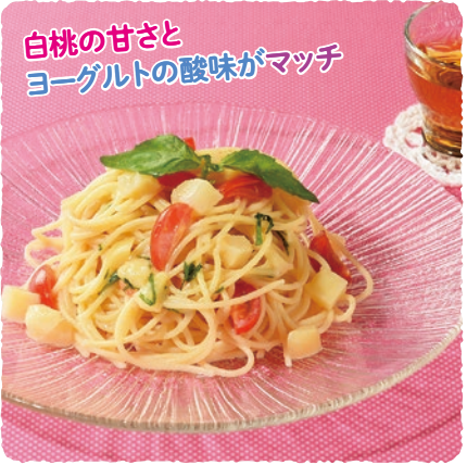
白桃の甘さと ヨーグルトの酸味がマッチ