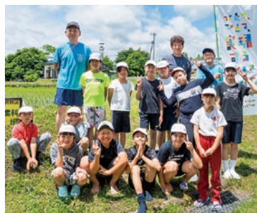
喜多市立熱塩小学校

熱塩小学校では、子どもたちが、地域の方々の協力をいただきながら有機農業に取り組んでいます。自分たちで育てた「もち米」や「小豆」で作った赤飯をご高齢の方へ届ける活動などにより、自分が地域の一員であるという意識を育んでいます。また、地域に伝わる伝統野菜の栽培を通じて、地域ならではの特色も学んでいます。これからも地域の方々とつながりを大切にしながら、子どもたちが地元を誇り、人のやさしさや思いに寄り添えるよう、「ふるさとを愛し自ら学び心豊かにたくましく生きる」ことを実現していきます。