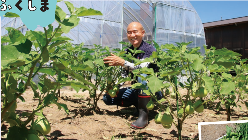
西洋野菜は近隣市町村の飲食店や小売店に卸し、平田村の学校給食にも取り入れられています。