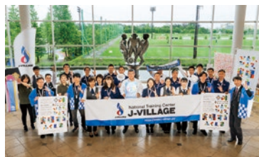
Jヴィレッジ社員の皆さん

Jヴィレッジは、日本初のサッカーナショナルトレーニングセンターとして1997年に誕生し、「サッカーの聖地」としてたくさんの方に愛されてきました。東日本大震災後は原発事故収束の対応拠点となりましたが、皆さまからご支援とご協力を頂き、2019年4月に8年ぶりに全面営業を再開しました。