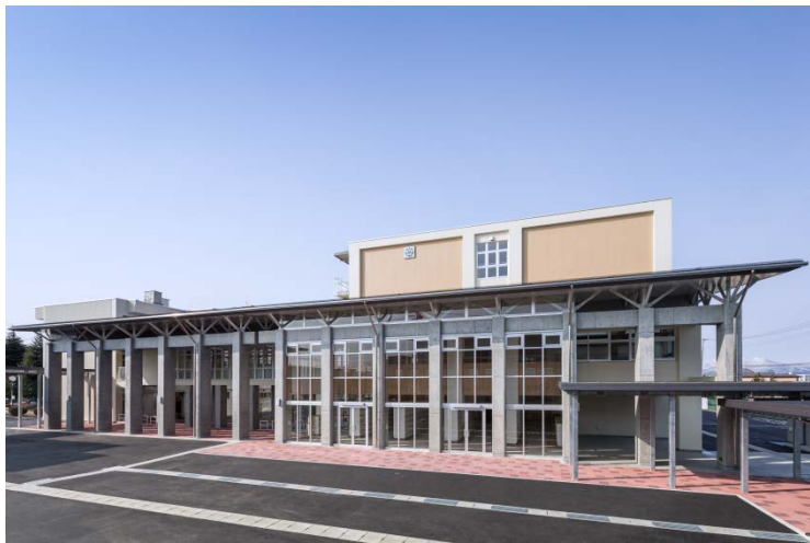
北校舎東面（昇降口）