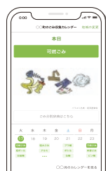
福島県 環境アプリ

県では地球温暖化対策にもつながる「ごみ減量化」や「省エネ」の推進を目的に制作した「福島県環境アプリ」を公開中です。このアプリで、気軽にエコ活動を実践しましょう！