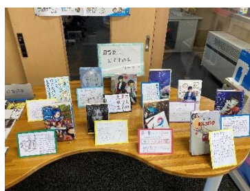
【図書委員 P O P 展示】