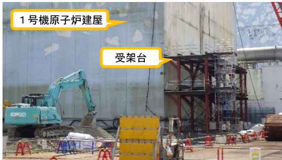
(写真1-1) アンカー削孔装置の受架台設置状況 (北西側から撮影)