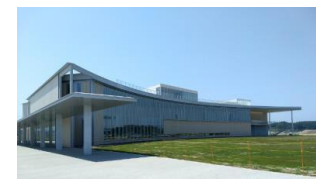
東日本大震災・原子力災害伝承館