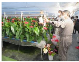
拠点の視察ツアー(川俣町)