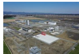
福島ロボットテストフィールド