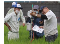
ICTを活用した水田管理実習 (相馬農業高校)