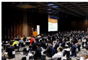
企業立地セミナー