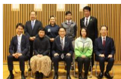
総理との車座(センター長出席)