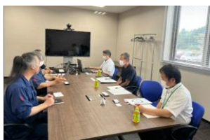
企業間マッチング

企業誘致、実用化開発や事業化の支援、企業間マッチング機会の創出など、産業集積を促進する取組を実施。