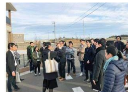
大学と地域の連携 (東京大学×新地町)

浜通り地域等での大学等の教育研究活動や、初等中等教育でのイノベーション人材育成を支援。