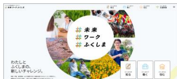
情報発信ポータルサイト