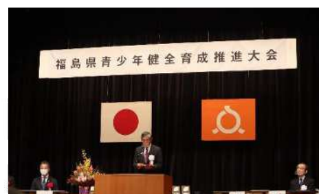
【令和4年度 福島県青少年健全育成推進大会】