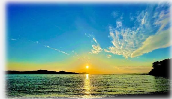
宿泊先より→日の入り

年末旅行お気に入りの写真です。おみくじは全て大吉でした。今年も良いことがあるよう祈っています。