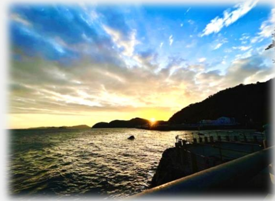
←夫婦岩から日の出