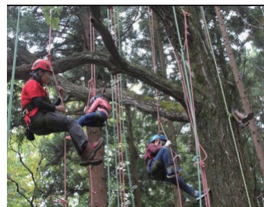
地域創生総合支援事業