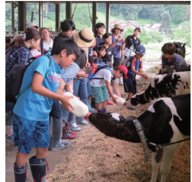
グリーン・ツーリズム