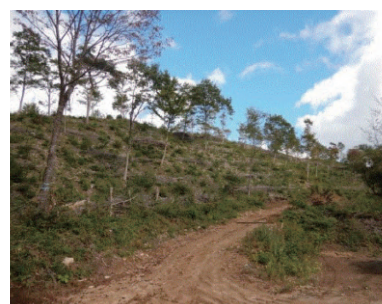
ふくしま森林再生事業