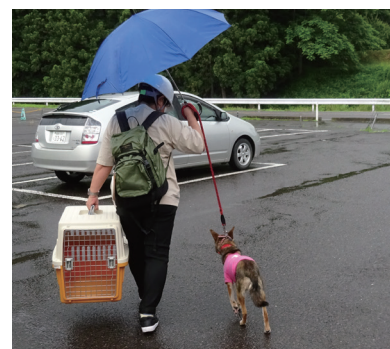
被災動物の収容、ペット同行避難の援助、動物用飼料の備蓄等(動物愛護センター)