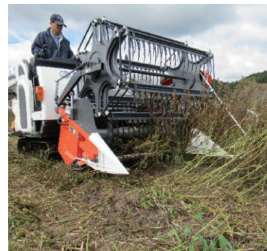
新たな経営・生産方式(エゴマ収穫の大型機械導入)