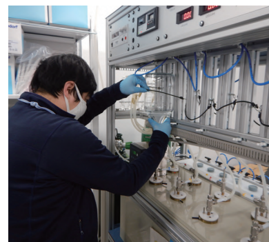
放射性物質の低減等に係る調査研究や技術開発(環境創造センター)