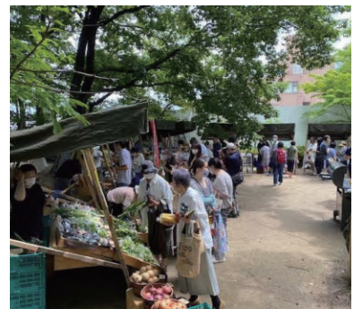
マルシェによる販売・PR