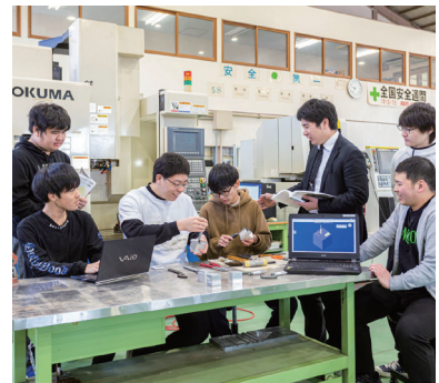
高度産業人材育成確保(テクノアカデミー郡山)