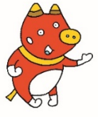
福島を応援する「ペコ太郎」

福島県では、東日本大震災から13年以上が経過する中で、 福島県の復興の状況 をより多くの方に知っていただけるよう、 復興に関する10の疑問 を、図や写真でわかりやすくまとめた資料を作成しています。