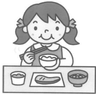
委員会での標語募集

朝ご飯、昼ご飯、夜ご飯、ちゃんと食べよう。 主食、主菜、副菜、汁、物のスイッチオン!