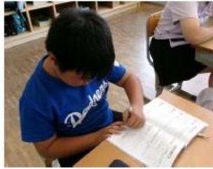
(自分手帳を記入している様子)

4～6年は朝の時間などを利用して、自分手帳の食生活のページを活用させ、自分の朝食について振り返らせたり見直しさせたりした。