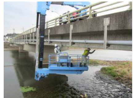
橋梁点検(イメージ)

異常気象等により現場公開を中止する場合があります。このため、【別紙2】により取材を希望される方の事前受付をさせていただきますので御了承願います。