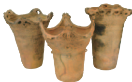
「磐梯町法正尻遺跡出土縄文土器」

東日本の縄文時代を代表する青森県の特別史跡三内丸山遺跡の出土資料と、当館所蔵の国指定磐梯町法正尻遺跡の出土資料を並列展示して、縄文文化の地域的な多様性を紹介します。