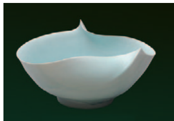
第67回展 福島県美術大賞 「innocent blue」近藤 賢