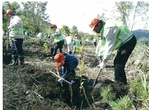
企業の もり 森林づくり活動（下郷町）

また、多様な担い手による森林づくり活動を活性化していくためには、これまでに森林づくりに携わったことのない方々が、森林に身近に感じてもらい、理解を深め、森林づくり意識を持つための県民参加の促進が必要である。