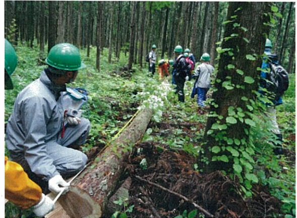
もりの案内人養成講座

森林づくり活動を進めるより専門性の高い指導者が必要となることから、幅広い知識と技術を有する もり 森林づくり指導者を積極的に養成する必要がある。特に放射性物質のリスクコミュニケーションなど新たな課題に対応する高度な知識・技術が必要なことから、指導者のフォローアップ研修等の充実にも配慮するとともに、指導者の活動拠点の拡充についても対策を講ずる必要がある。