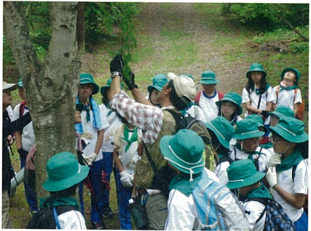
もりの案内人による自然観察会

「森林を全ての県民で守り育てる意識の醸成」については、県事業として森林環境学習に必要なフィールドの整備、指導者の養成、森林ボランティアの養成、森林文化企画展等が実施されたほか、市町村が独自性を発揮して住民を対象に市町村事業として行う観察会や小中学生を対象とする森林環境学習の実施などを通じ、県民参画の推