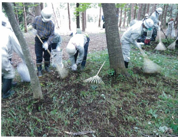
県民の森の森林除染

震災における津波や原発事故による放射性物質の影響を受けた森林を「怖いところ」とイメージしている県民は少なくない。森林は、木材生産のみならず、森林づくり活動や子どもなどの野外活動等の場、さらには森林文化を育む貴重な資源であり、震災前の環境を取り戻すことが急務であることから、除染や森林再