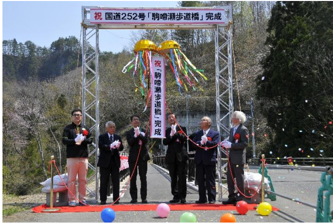
【くす玉割りの様子】

平成26年4月26日（土）に大沼郡三島町大字川井地内において、完成式が盛大に執り行われました。 「道の駅 尾瀬街道みしま宿」と展望台に至る遊歩道が結ばれ、安全に通行できるようになりました。