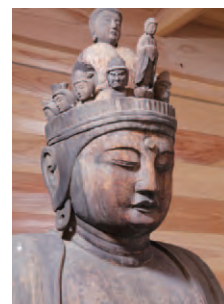
「木造十一面観音立像」 重文 勝常寺蔵

東日本大震災からの復興を祈念して、古くから信仰を集めてきた東北各地の観音像を展示します。三十三観音や札所めぐり、観音講や多彩な奉納品など、人びとが祈りを捧げてきた歴史や民俗もあわせてご紹介します。