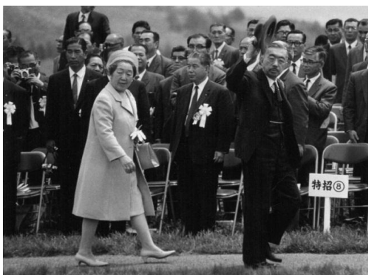
大会会場にご到着された天皇皇后両陛下