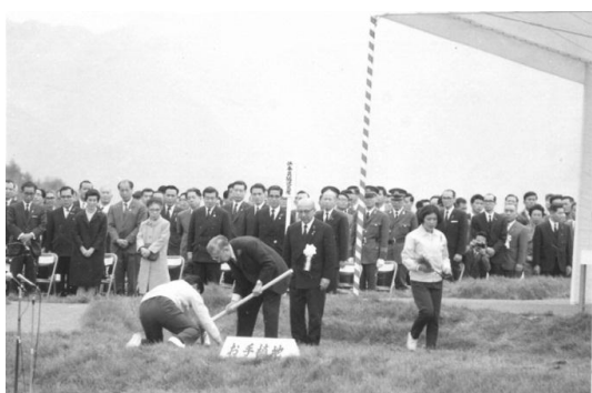
天皇陛下によるお手植え