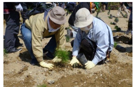
森林（もり）づくり活動の事例