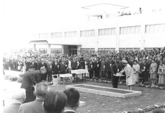
天皇皇后両陛下のお手播き 郡山市 福島県林業試験場にて (昭和45年第21回全国植樹祭)