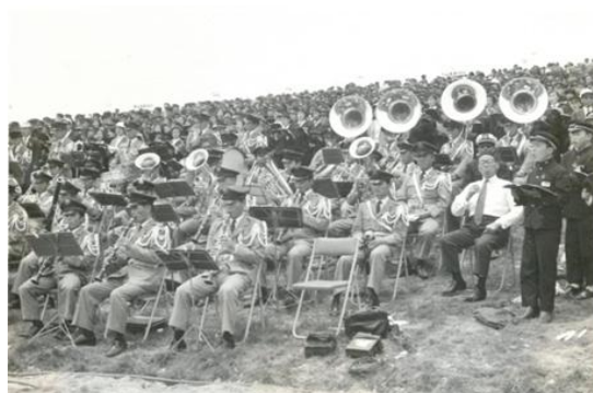
陸上自衛隊音楽隊による演奏