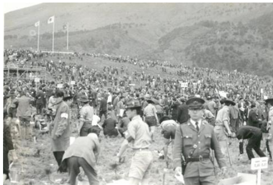
一般参加植樹状況