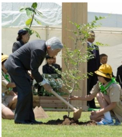
天皇陛下 お手植え

参加者の植樹樹種は、各会場の特性に沿って選定し、県内外の参加者は、1人複数本を植栽していただきます。なお、詳細については、「基本計画」の中で検討します。