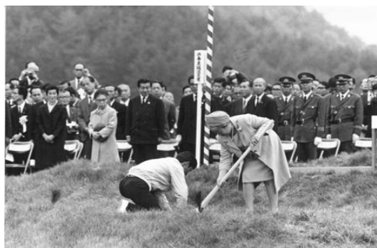
皇后陛下によるお手植え